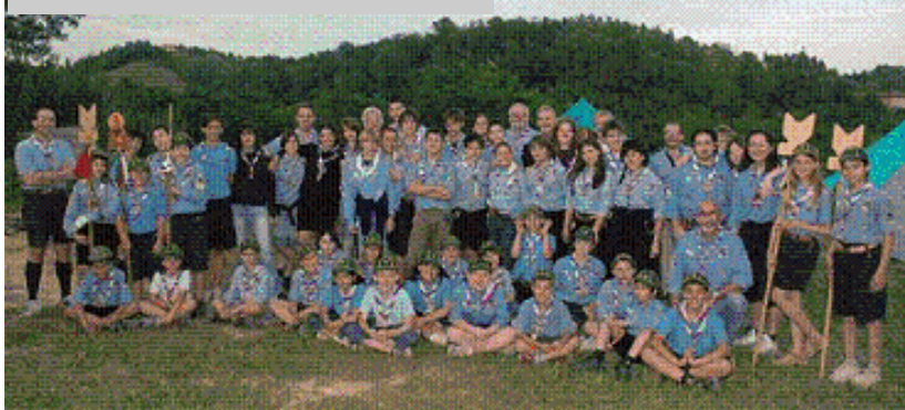
Il gruppo scout di Callianetto il giorno del Ventennale di fondazione.