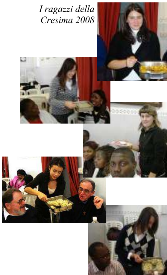
I ragazzi della Cresima 2008

te, perché ci ha permesso di conoscer-ci meglio e scoprire come queste per-sone vivano gioiosamente la loro fede. Vorremmo concludere la nostra espe-rienza con una frase di P. Secondo che ha segnato il nostro cammino cri-stiano, nella speranza che anche altri ragazzi raccolgano questo messaggio di speranza per una società migliore: “Così dico ai giovani, se avete il co-raggio di uscire dalla mediocrità, di cambiare vita per amore di Cristo e dei fratelli, sarete felicissimi.”