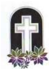
MERLONE PALMINA † 28-06-08