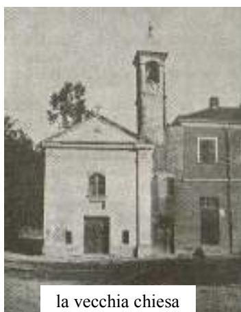
la vecchia chiesa

conoscenti per il loro prezioso interessamento all'attuazione dell'iniziativa, che auspichiamo sempre più vantaggiosa alle popolazioni della zona.