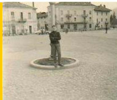
1956 - La piazza centrale di Giaveno. La curiosità è che si vede una sola auto sullo sfondo ... altri tempi !!