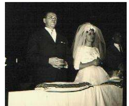
Matrimonio celebrato da Mons. Giovan Battista Pinardi che è stato parroco di San Secondo in Torino dal 1912 al 1962, anno della sua morte.