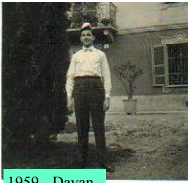
1959 - Davanti alla casa di zio Quinto. Avevo fatto amicizia con un piccolo coniglietto che stava tranquillo sulla testa senza spaventarsi.