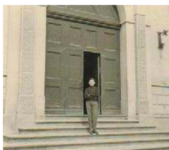
1956 - Io davanti al portone del Seminario di Giaveno.