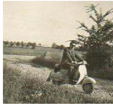
1960 - la mia prima vespa 125 - fino al '66 è stato il mio unico mezzo di trasporto. Poi l'ho ancora venduta che aveva 135.000 Km.