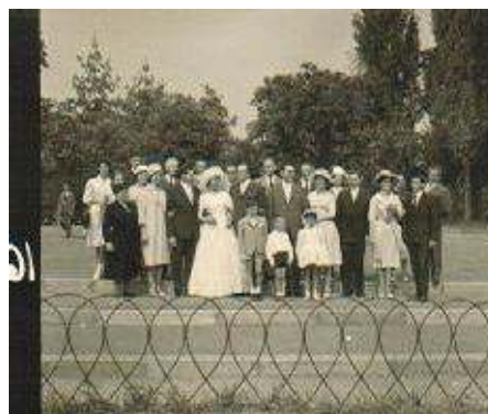
Tutta la famiglia al Valentino per foto ricordo e rinfresco.