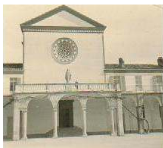
1956 - Il cortile interno del Seminario di Giaveno.