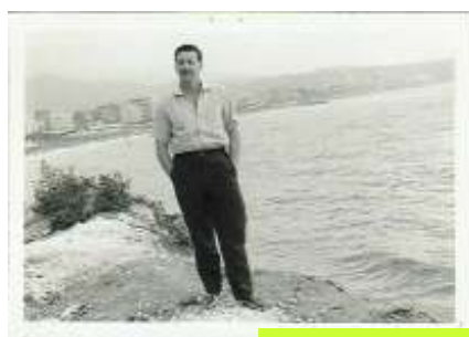
1966 - Gita a Savona