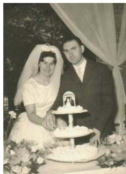
Il taglio della torta