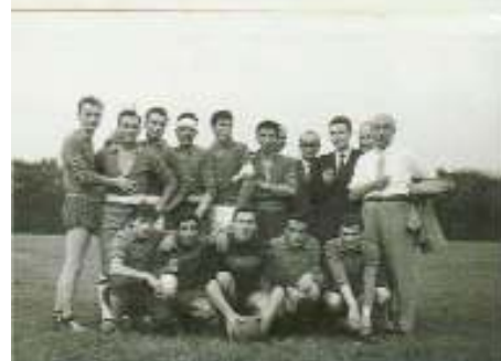
1964 - Squadra di calcio operai-impiegati della Rivoira. Mi avevano fatto fare il portiere, visto che avevo difficoltà a correre.