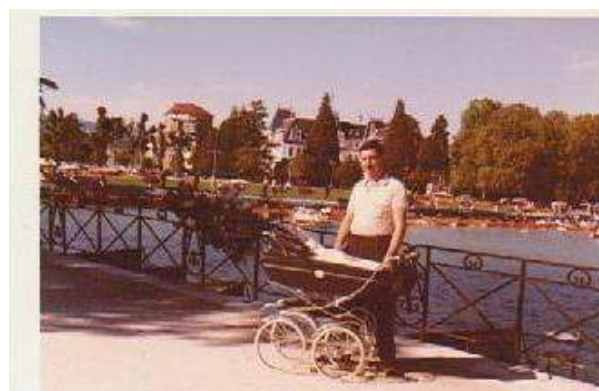
1966 - Al lago di Annecy