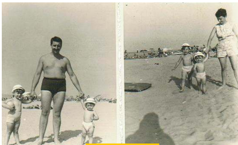
1969 - Jesolo