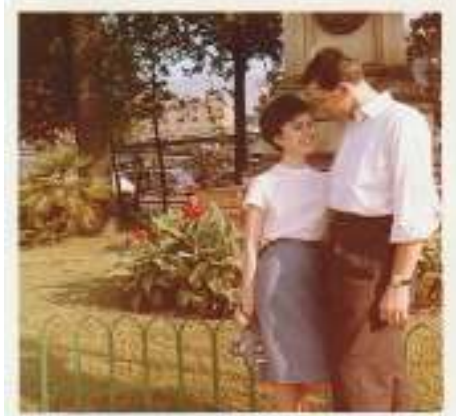
1965 - viaggio di nozze a Genova