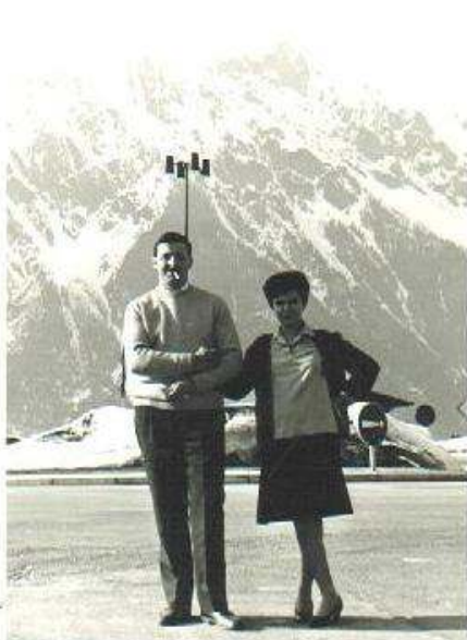
1966 - Monte Bianco - andando ad Annecy.