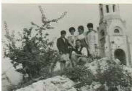
1964 - Annecy