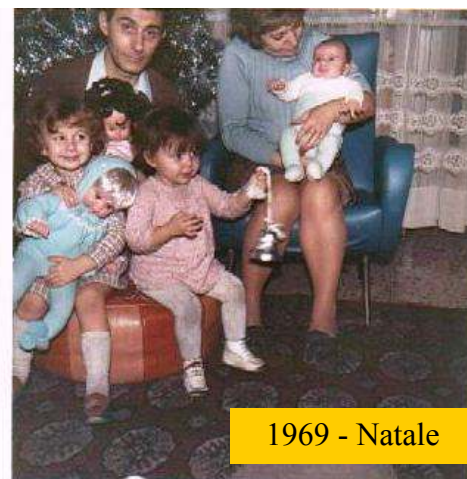
1969 - Natale