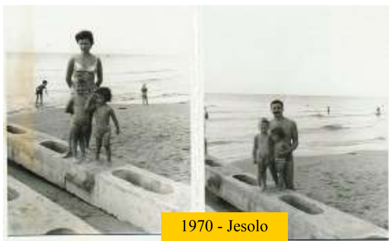
1970 - Jesolo