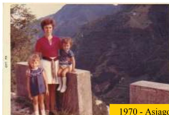
1970 - Asiago