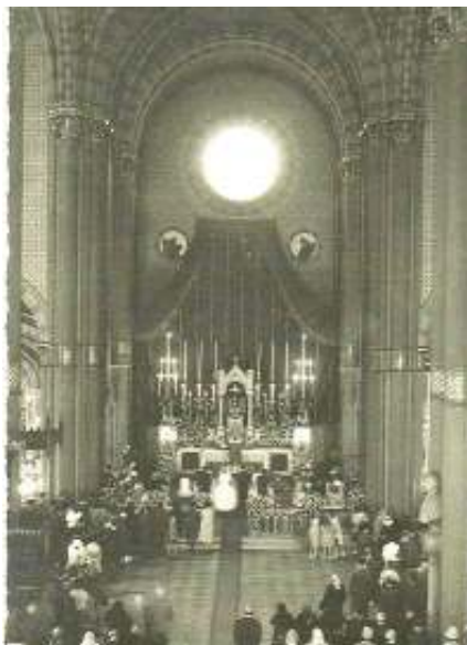
Chiesa San Secondo