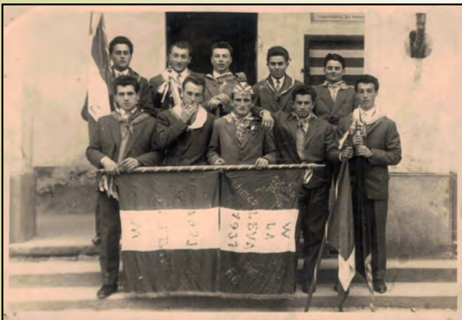
Foto della Leva del 1937

Festeggiare i nostri anziani significa far risaltare la loro saggezza nonostante le tante difficoltà che hanno dovuto affrontare, ringraziarle perché la loro presenza