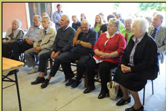
I festeggiati al giorno d'oggi

La leva del 1937, rappresentata da ben 14 ottantenni tutti pimpanti, persone che non dimostrano la loro età anagrafica, che hanno ancora voglia di darsi da fare