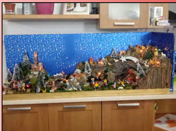
Presepe di Stefano Baldin