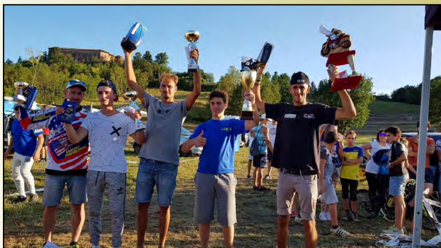
Podio Frincross categoria Master 2017