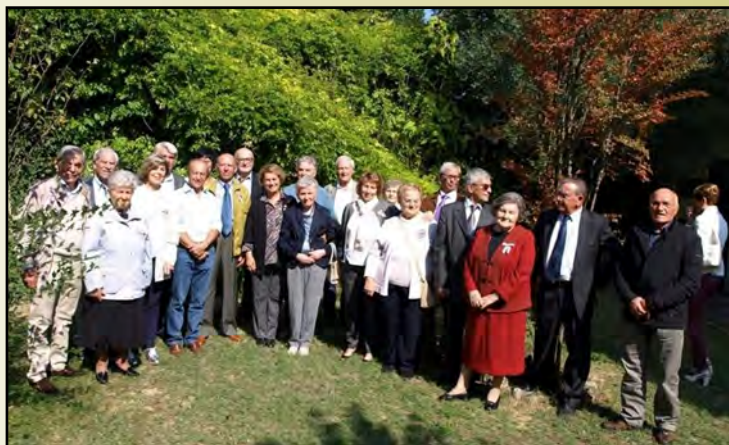
La leva del 1947