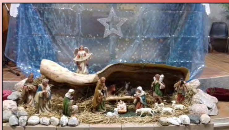
Presepe della chiesa