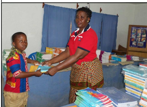
Florantine distribuisce materiale scolastico