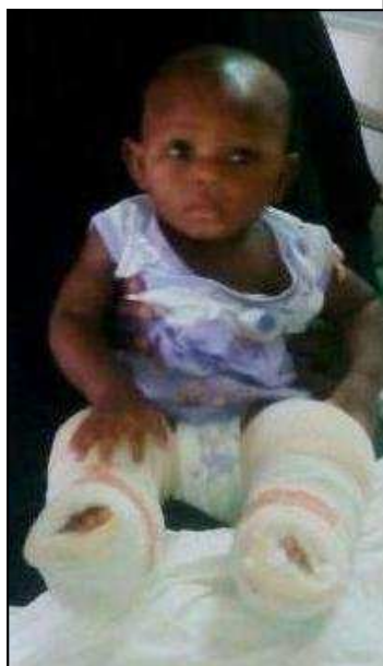
Animata - dopo